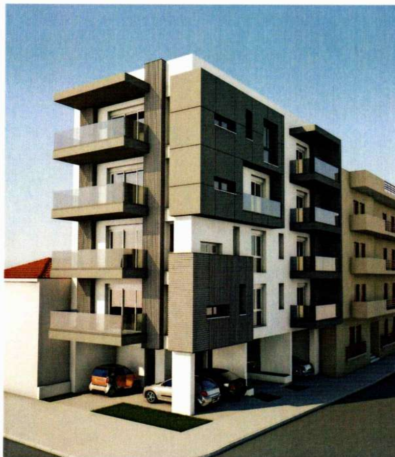
ΤΡΙΣΔΙΑΣΤΑΤΗ ΑΠΕΙΚΟΝΙΣΗ ΜΕΛΕΤΗΣ